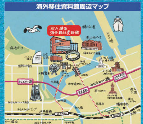
みなとみらい線「馬車道」駅(4番出口)から徒歩約8分