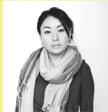
AI IWANO